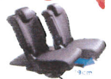
トップアップ & タイプダウン機能付 スライドラリアシート