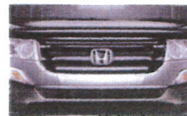
専用フロントグリル