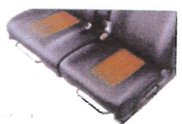
運転席 & 助手席シートヒーター VVTL-Eは標準装備