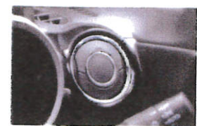
エアコンアウトレットダブルリング