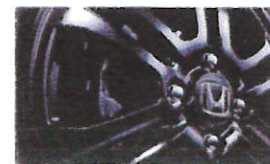
オールブラック 14インチアルミホイール