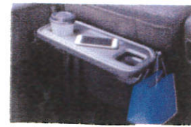
シートバックテーブル (運転席/助手席)