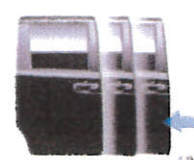
パワースライドドア (リア右側) ターボSSパッケージは標準装備