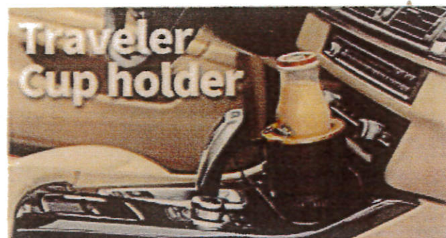
※シガープラグ付き DC 電源ケーブル付

長距離ドライブなどで、ドリンクホルダーに置いてある飲み物が 夏場にはどんどんぬるくなり、冬場にはどんどん冷たくなっていきます。 そんなときに便利なのが車内に設置できる保冷・保温器です。